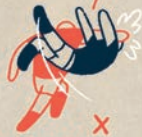
TACKLING OBERHALB DER SCHULTER