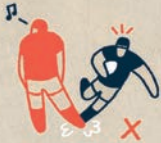
BEIN STELLEN, GRÄTSCHEN

BEGEHT EIN SPIELER EIN FOUL, KANN ER MIT EINER GELBEN KARTE FÜR 10 MINUTEN ODER MIT EINER ROTEN KARTE FÜR DEN REST DER PARTIE VOM PLATZ GESTELLT WERDEN.